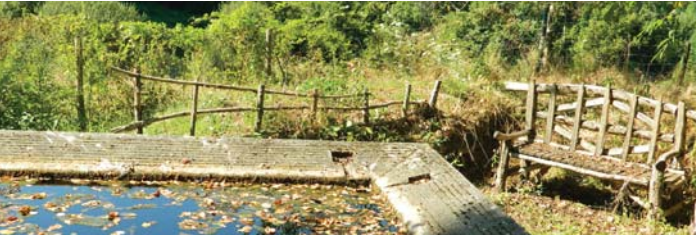
Un lavoir à la Bénèche

L'arbre à prières ou arbre votif est une coutume religieuse pratiquée dans de nombreuses régions du monde. Elle consiste à utiliser un arbre vivant, ou une partie coupée d'un arbre que l'on plantera en un lieu bien choisi, comme support à des requêtes que les hommes font aux esprits. Ce type de culte est pratiqué notamment dans les religions chamaniques. (Source Wikipédia)