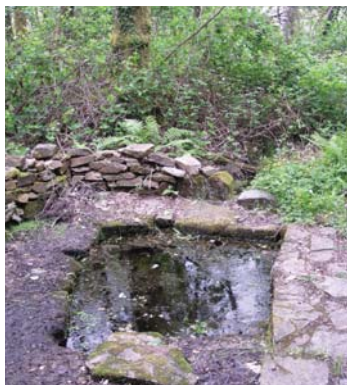
Bonne fontaine, sur le site privé des bonnes fontaines

L'arbre à prières ou arbre votif est une coutume religieuse pratiquée dans de nombreuses régions du monde. Elle consiste à utiliser un arbre vivant, ou une partie coupée d'un arbre que l'on plantera en un lieu bien choisi, comme support à des requêtes que les hommes font aux esprits. Ce type de culte est pratiqué notamment dans les religions chamaniques. (Source Wikipédia)