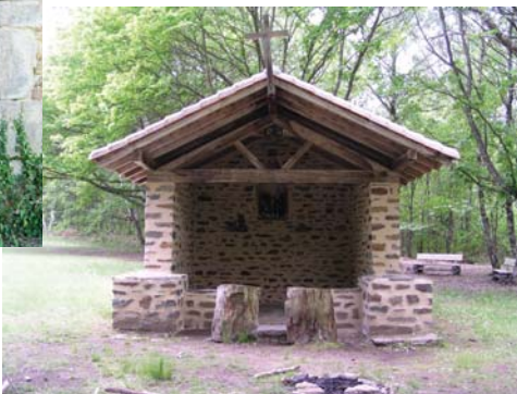
Oratoire des bonnes fontaines

Les fontaines à dévotions constituent un patrimoine emblématique du Limousin. Parmi celles-ci, les " bonnes fontaines " de Cussac jouissent d'une très forte notoriété. Le site qui les accueille, pittoresque et agréable, a été spécialement aménagé afin de partir à la découverte de ses fontaines, de ses richesses naturelles et culturelles et de l'histoire du lieu grâce aux panneaux d'information qui le jalonnent (fontaines, oratoire, batraciens, châtaigneraie). Les bonnes fontaines se prêtent également à la détente et au pique-nique : tables, bancs, boulodrome... sont à votre disposition. Le peuplement de châtaigniers, conduit en verger, agrmente le site et apporte ombrage et fraîcheur. (Source PNR PL)